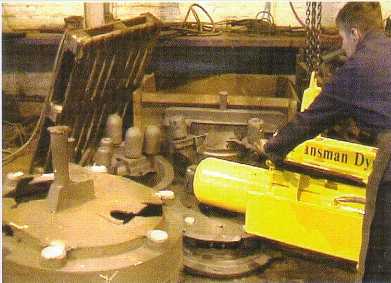
▶ Clansman CC100 Canon