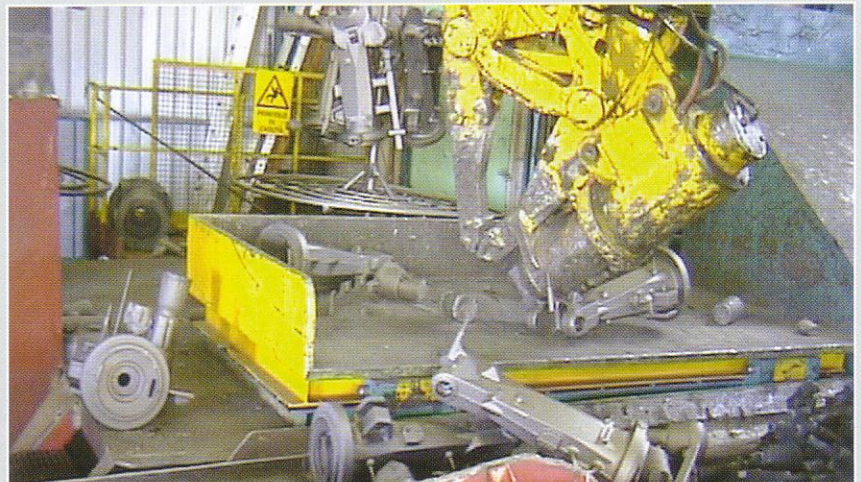
▶ Clansman C3010 Manipulator + CC100 Canon – hits gating to separate from casting. Télémanipulateur Clansman C3010 + Canon CC100 – Séparation des pièces des jets de coulée par chocs. Clansman C3010 Manipulator mit CC100 Canon-Clansman Schlaghammer – Trennen Kreislauf von Gußstück. Manipolatore Clansman C3010 + “Canon” CC100 – colpisce le colate (o le materozze) per separarle dai getti.