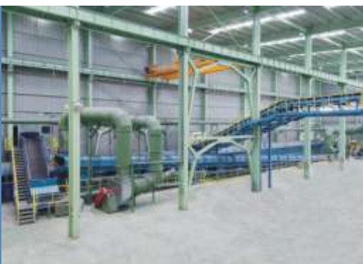
Sistema de resfriamento de peças