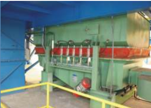
Resfriador de areia de leito fluidizado