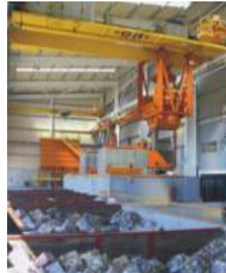
Preparação de carga metálica e aditivos