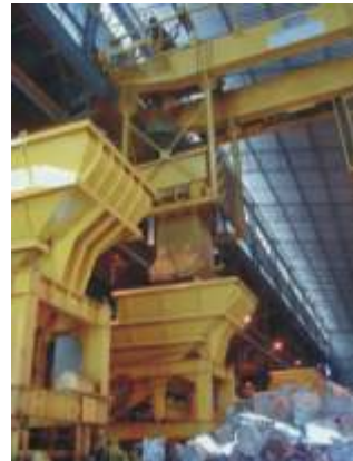
Carro de carregamento