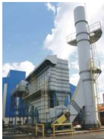
Filtro de mangas