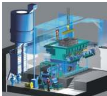
Desmoldador e recuperador mecânico de areia cura a frio