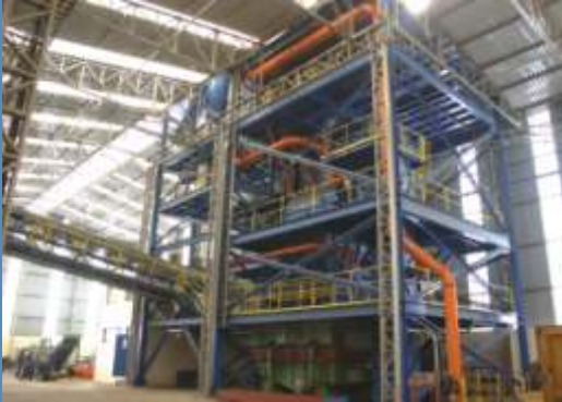
Sistema de recuperação e preparação de areia verde