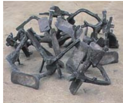
Antes / Before

La máquina soporta temperaturas de hasta 370°C sin sufrir daños. Los conos del mecanismo de trituración son de larga duración y se reparan fácilmente después de su desgaste.