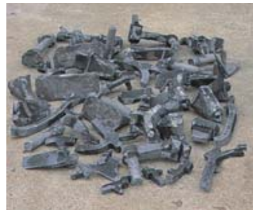
Después / After